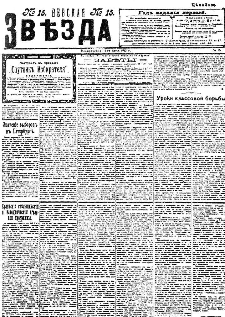
Primera página del periódico Niévskaia Zvezdá núm. 15 del 1 de julio de 1912 con los artículos de V. I. Lenin Importancia de las elecciones en Petersburgo y Comparación de los programas agrarios de Stolipin y de los populistas. Tamaño reducido.

Se publica de acuerdo con el texto del periódico.