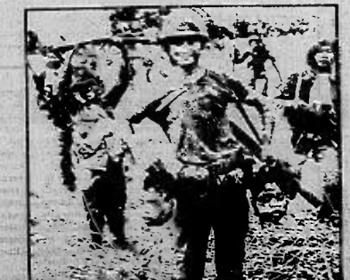
SALVAJISMO DE LAS TROPAS MERCENARIAS AL SERVICIO DE LOS YANQUIS

El argumento de que el mundo burgués podría utilizar a Trotsky para destruir a Hanoi, como un arma contra el socialismo, es insoportable. En