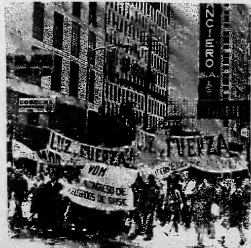
Manifestantes cordobeses durante el paro del 29 de enero.